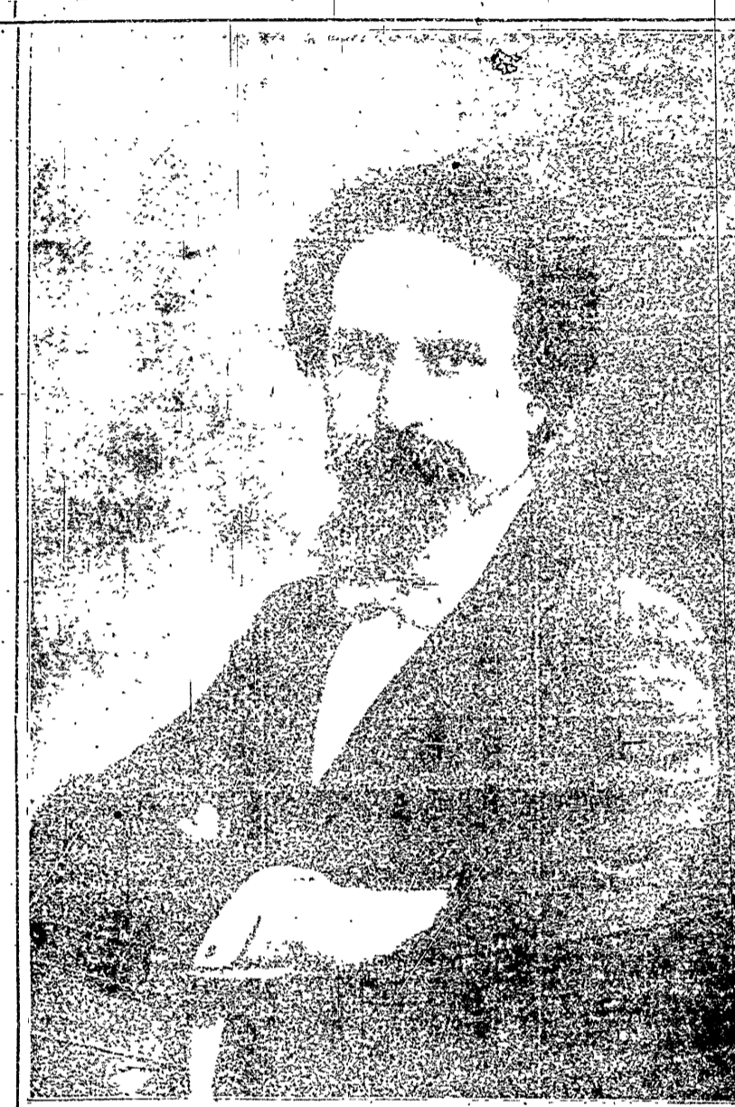
Al hombre de ciencia y compañero militante de las filas del Partido Socialista Internacional que llegó hoy al puerto de esta capital en el transatlántico "Príncipe de Asturias" acompañado de su familia, la redacción de LA VANGUARDIA les envía un afectuoso saludo.